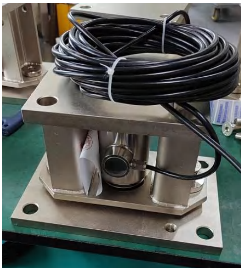
图 1 模块照片